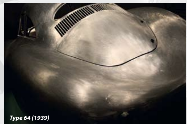
Type 64 (1939)